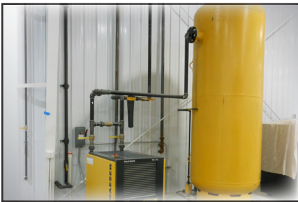
Simplemente conecte el CA al aire existente de la planta o a un compresor centralizado.