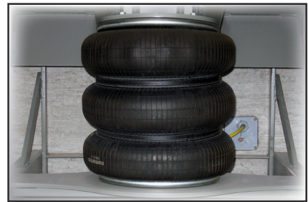
El sistema de fuelle de hule con correa de acero utiliza aire comprimido para elevar la plataforma.